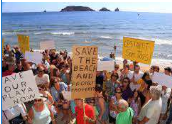
(manifestación verano 2015)

imprimiendo tantos ejemplares como convenga para ayudar a su divulgación.